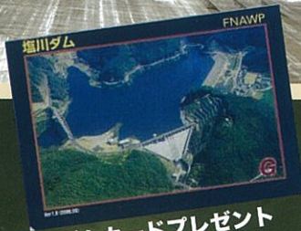
ダムカードプレゼント