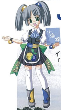
イメージキャラクター 「ぶりっちゃん」

JR小海線の車窓から稲絵アートをご覧ください!! (小淵沢駅～甲斐小泉駅間の大カーブ)