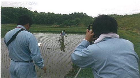
一点ずつ丁寧に測りだしをしました。