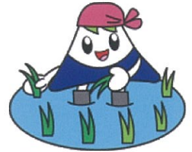
富士の国やまなし国文祭 マスコットキャラクター 「カルチャくん」